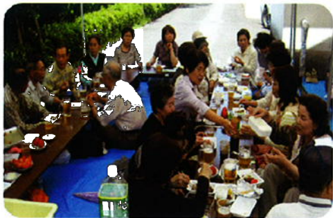
21年度 焼肉交流会の様子