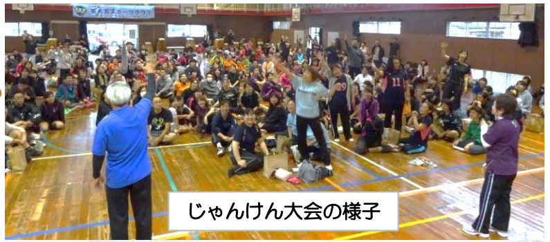
じゃんけん大会の様子

ゴールド混成の部 ヴィッツ シルバー混成の部 プライド 混成一般の部 ソフトクリームB 女子一般の部 ワンビーズA